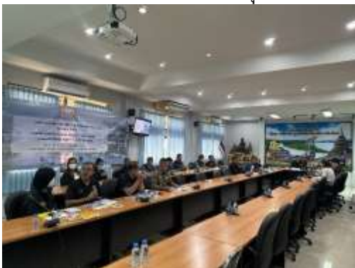
บรรยากาศผู้เข้าร่วมประชุมรับฟังการบรรยาย