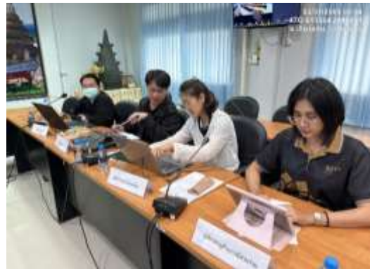
กลุ่มบริษัทที่ปรึกษา นำเสนอรายละเอียดโครงการ