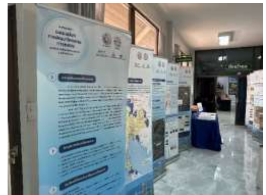
บรรยากาศชมบอร์ดนิทรรศการ